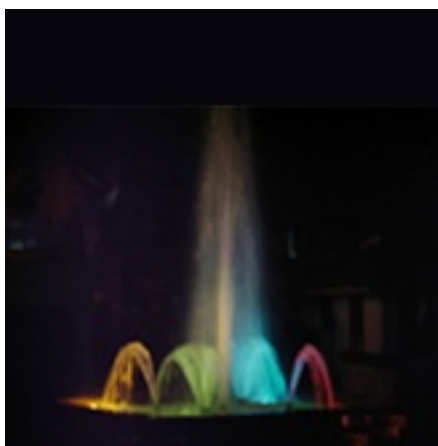
Rys. Dysza Fan-Jet w zespole z dyszą centralną